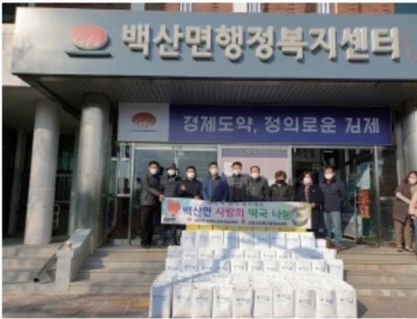
▲ 사랑의 떡국 나눔-김제백산

2020년 전북지역 수해피해민 지원 300만원을 시작으로 김제시 정육 340kg 1,000만원, 김제시 백산면 정육 70kg 200만원, 고창군 정육 170kg 500만원, 부안군 정육 100kg 300만원, 익산시 정육 100kg 300만원, 전주 덕진구 정육170kg 500만원, 총 3,100만원의 소고기를 후원 하였습니다.