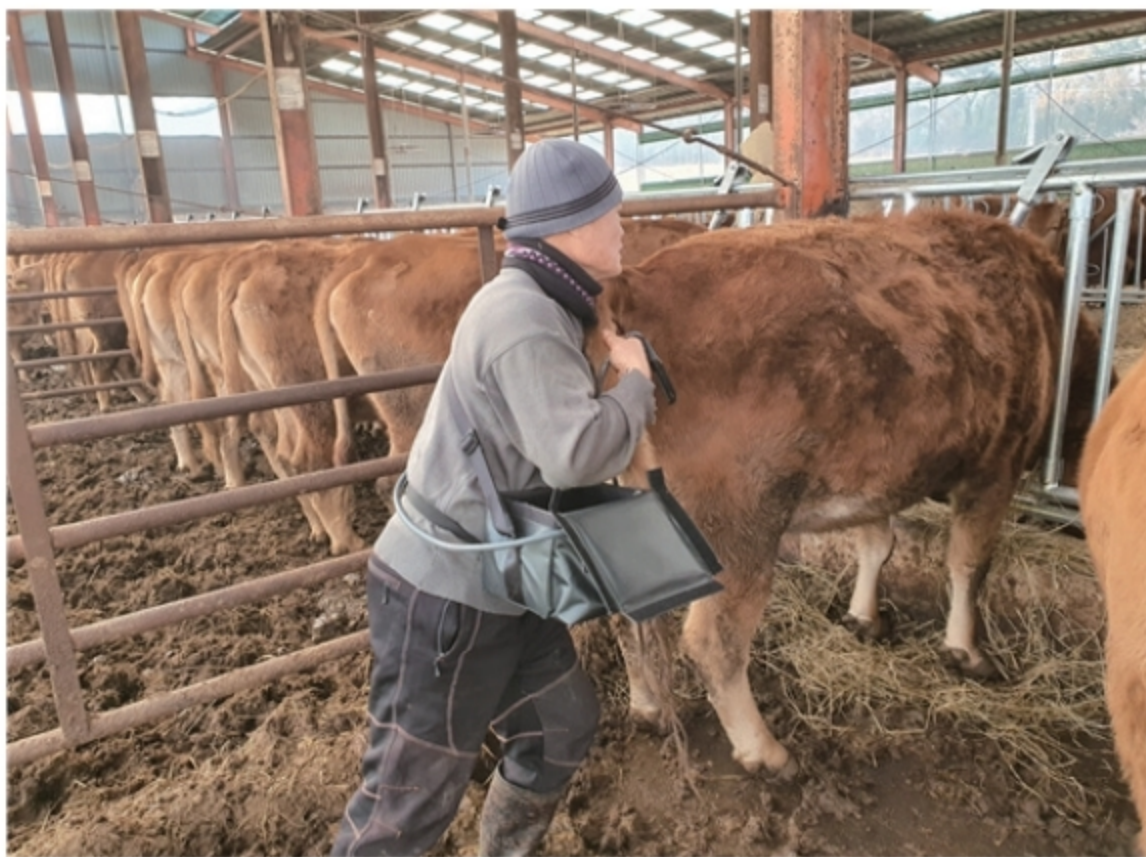
※ 활용농가의 예