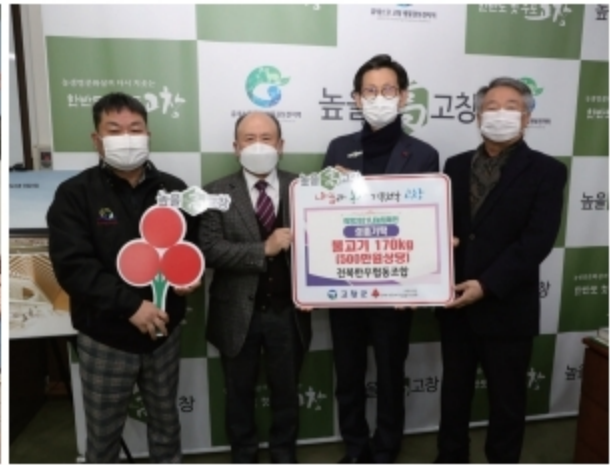
▲ 고창군 정육 170kg 500만원