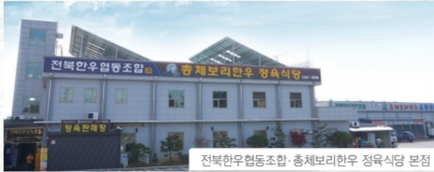
전북한우협동조합·총체보리한우 정육식당 본점