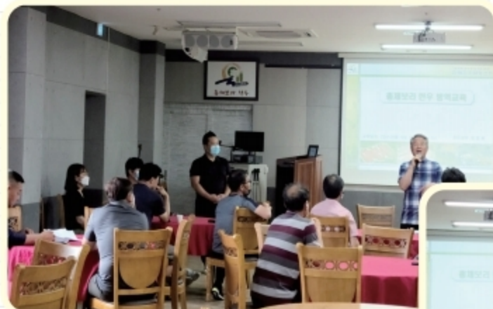
“2020. 6. 26” 위.예탁장 관리자 교육