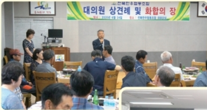
“2020. 6. 24” 제10대 대의원 상견례 및 화합의장