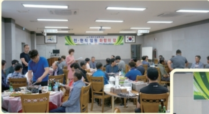
“2020. 6. 18” 전·현직임원 화합의장