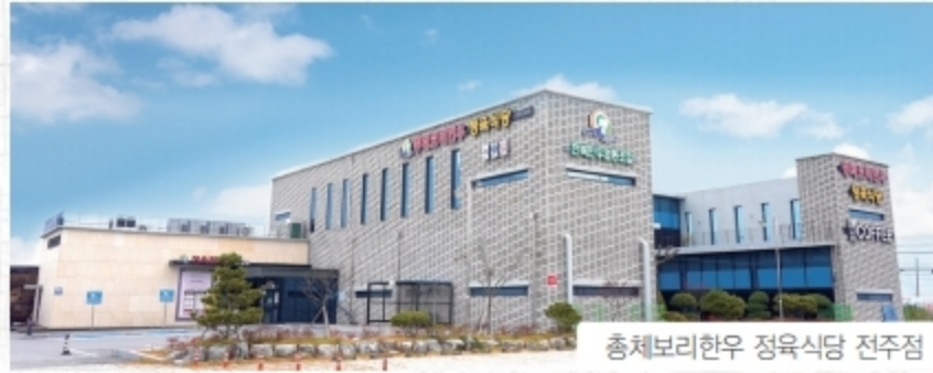
총체보리한우 정육식당 전주점