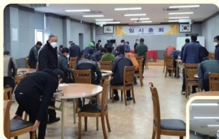
“2020. 11. 27” 임시총회